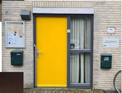
De Peppel Hillenaarlaan 18 2241 HX Wassenaar