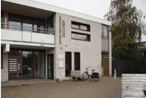
De Oosthof Donker Curtiusstraat 69 2241 NK Wassenaar