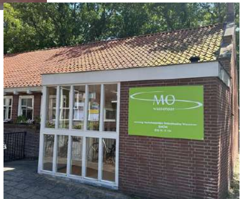
SMOW Van Heeckerenstraat 2 2242GX Wassenaar